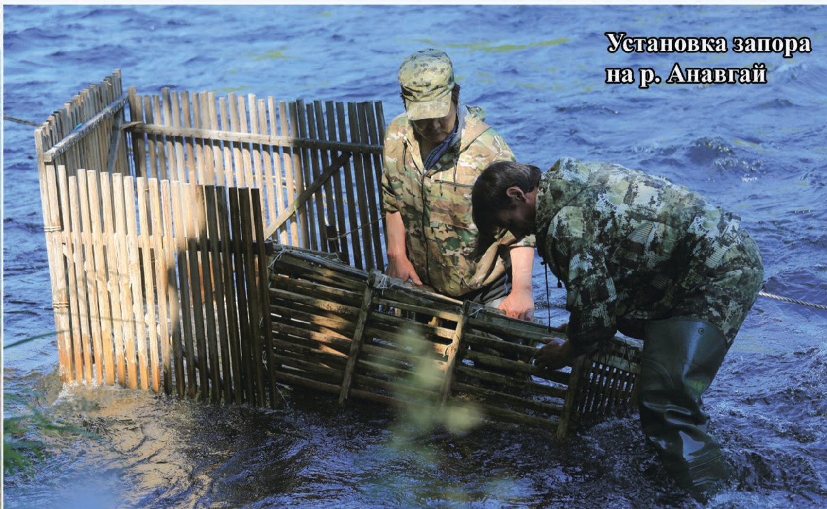
Установка запора на р. Анавгай