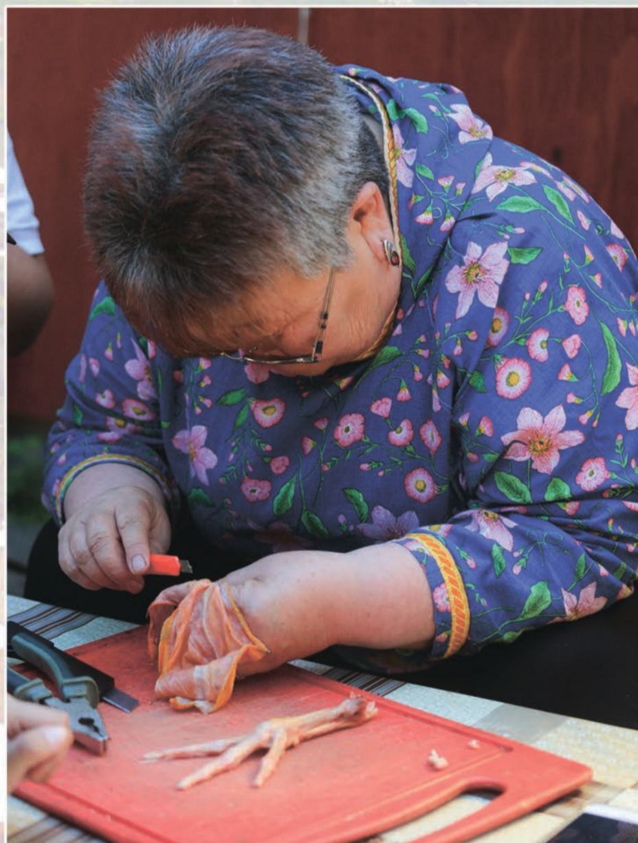
Мастер-класс по изготовлению сумочки из гусиных лапок